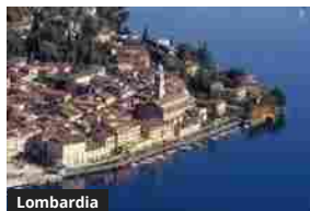
Lombardia Turismo: Lombardia e Veneto protagoniste della Bit con il Lago di Garda