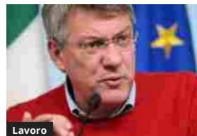
Lavoro Landini: vogliamo un accordo sulla sicurezza sul lavoro