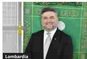
Lombardia Casa, protocollo d'intesa Regione-sindacati inquilini per le domande telematiche di assegnazione alloggi